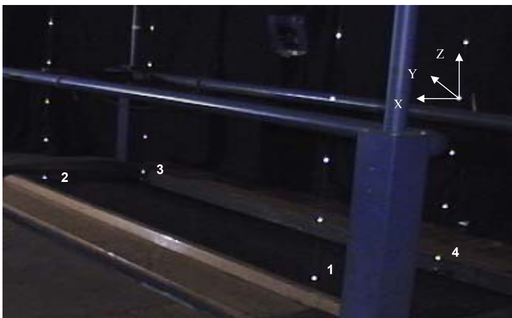
Figura 2. Demarcação tridimensional do ambiente de filmagem do qual se visualizam os quatro calibradores (1, 2, 3 e 4) e seus marcadores dispostos verticalmente sobre a esteira rolante. Um sistema de coordenadas está representado sobre um dos marcadores.