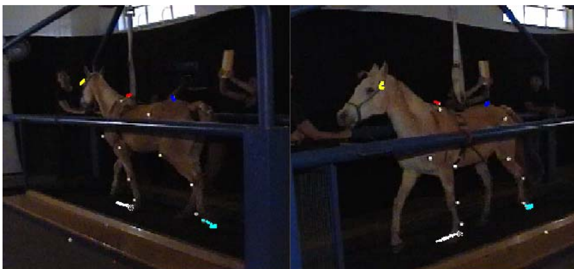
Figura 4. Equino na esteira de alto desempenho com os marcadores fixados em pontos anatômicos de interesse para análise de variáveis do movimento. Identificação e rastreamento de alguns pontos pelo sistema de análise do movimento (pontos coloridos).